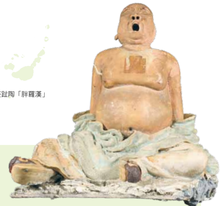
●國寶- 葉王交趾陶「胖羅漢」

扇扇，又名龜跌（音同夫）、填下、霸下，傳說是龍生九子之一，有著烏龜的外表，力氣大，喜歡背負重物，因此多為石碑、石柱的底座及牆頭裝飾，是長壽和吉祥的象徵。扇扇和烏龜長得十分相似，但細看，扇扇有一排牙齒，而龜類並沒有，背甲上甲片數目和形狀也有差異。而因為扇扇為龍九子之一，因此也有做成龍頭龜身形象。