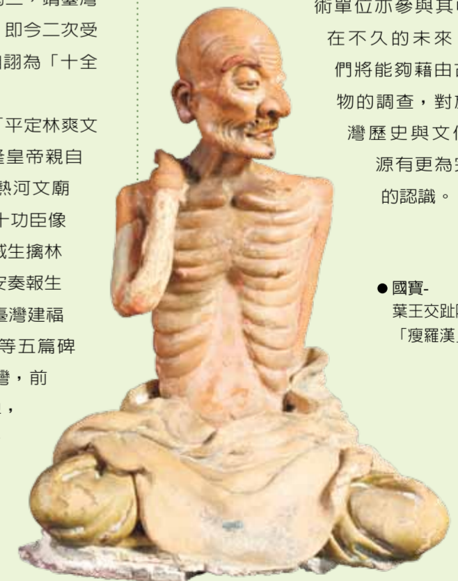
●國寶- 葉王交趾陶「瘦羅漢」

在不久的未來，我們將能夠藉由古文物的調查，對於臺灣歷史與文化資源有更為完整的認識。