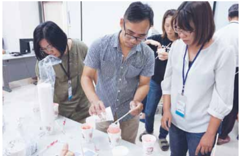
● 在模具中注入石膏液

品在製作過程中亦須增加可辨識性的符號圖案、數據或文字標示，以免與真品混淆；複製品、製作過程的模具、試驗品與總數量皆應造冊管理。