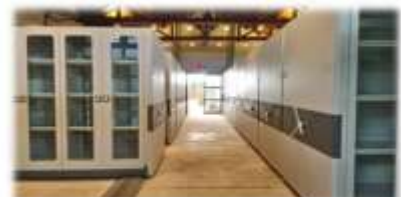
駁人式櫃架、移動式典藏櫃

全台唯一由地方政府成立的「臺南考古中心」，未來也將進駐園區，透過大面窗展示，讓民眾一窺考古工作神秘面紗。一旁設置有考古沙坑，提供親子進行考古體驗，讓文資保存教育扎根。另設置有文物典藏空間，依照文物類型，規劃不同存放模式，妥善收存本市豐富的出土遺物。