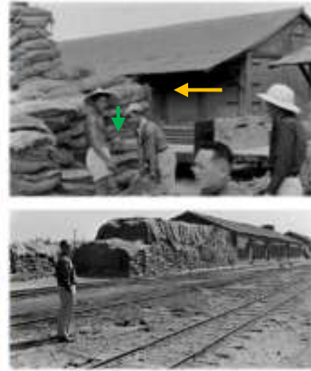
高橋・軌道與隆田堆棧場