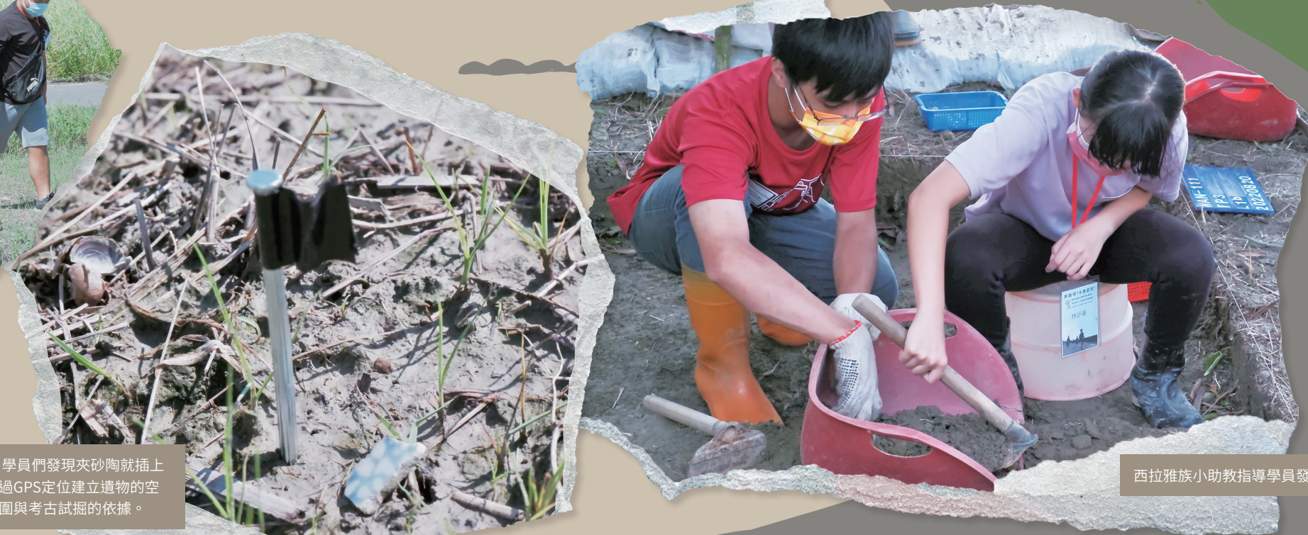
西拉雅族小助教指導學員發掘技巧。

夾砂陶、青花瓷片是地表調查的重點，學員們發現夾砂陶就插上紅色釘子，青花瓷則是黑色釘子，再透過GPS定位建立遺物的空間分布資訊，作為後續判斷祖先活動範圍與考古試掘的依據。