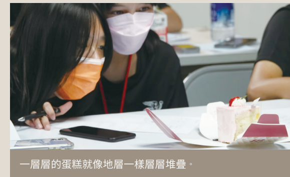
一層層的蛋糕就像地層一樣層層堆疊。

課程中，學員們透過蛋糕剖面的觀察，學習考古發掘中重要的「地層層位」概念，並試著描繪、記錄各層特質，完成蛋糕版的考古紀錄！