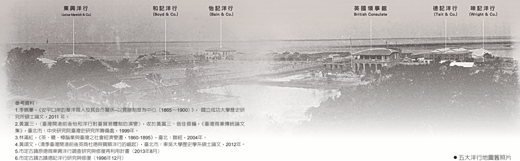
●五大洋行地圖舊照片