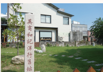
●和記洋行舊址地處立碑