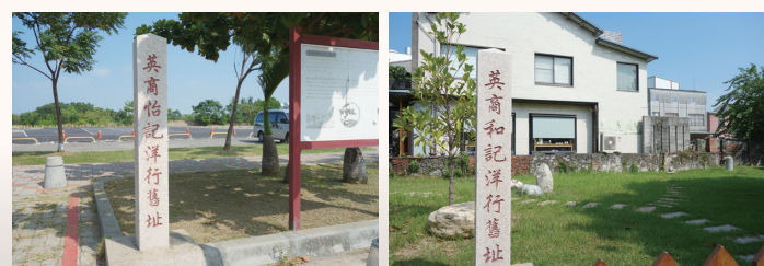
●怡記洋行舊址地處立碑