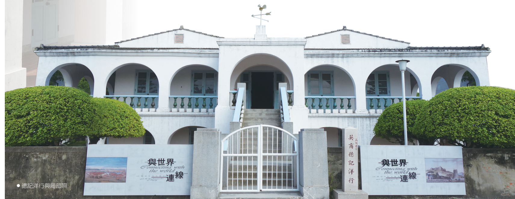
●德記洋行與高節照